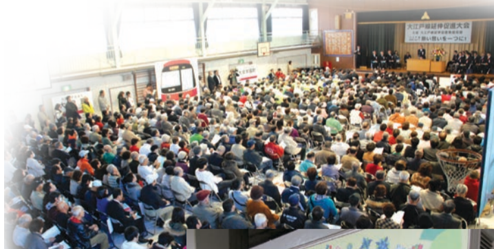
大江戸線延伸促進大会