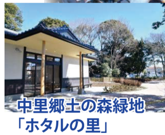
中里郷土の森緑地「ホタルの里」