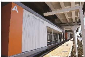
区立はつらつセンター