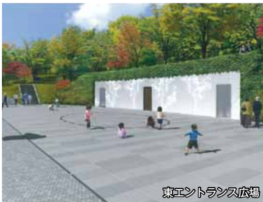
東エントランス広場