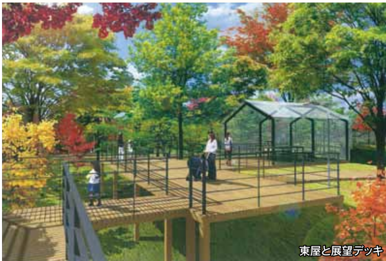
東屋と展望デッキ

練馬区議会議員として登庁以来推進して来ましたが、いよいよもみじ山公園として、外環ふたかけ部分を取得し、広大な公園として開園することになりました。更なる広大な公園として促進を要請しております。今後共皆様の声を反映させていただきます。